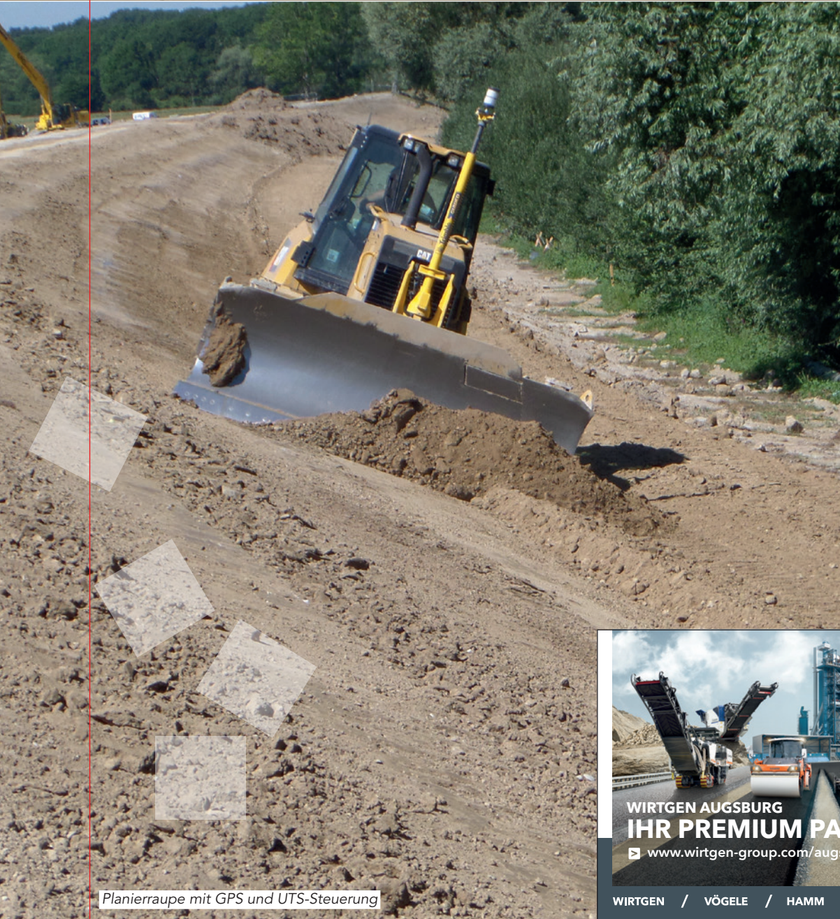
Planierraupe mit GPS und UTS-Steuerung