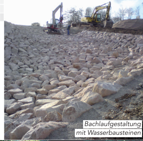
Bachlaufgestaltung mit Wasserbausteinen