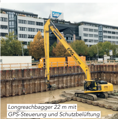
Longreachbagger 22 m mit GPS-Steuerung und Schutzbelüftung