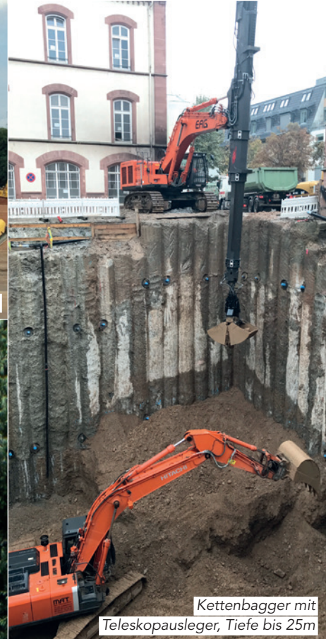
Kettenbagger mit Teleskopausleger, Tiefe bis 25m