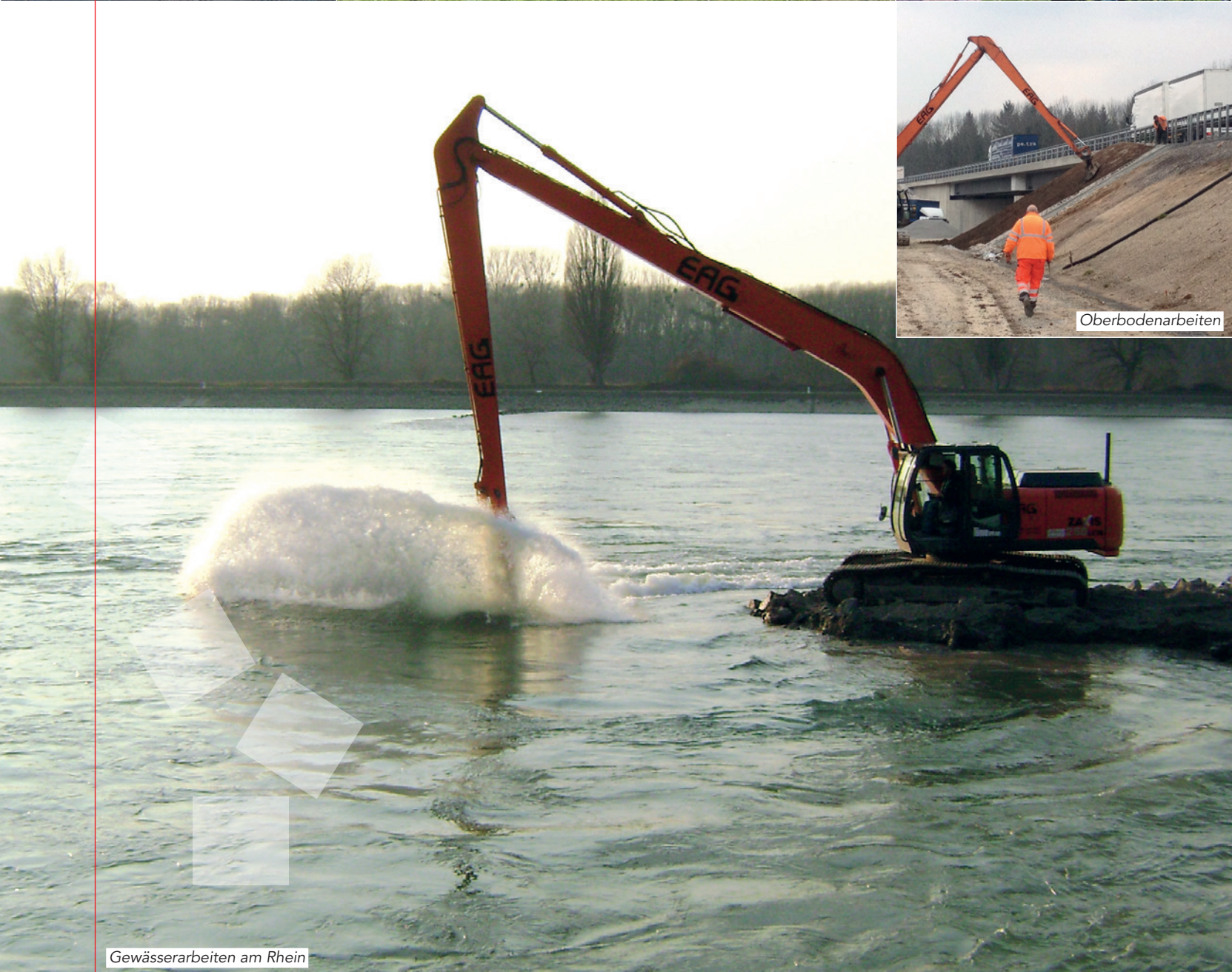
Gewässerarbeiten am Rhein