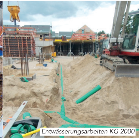
Entwässerungsarbeiten KG 2000