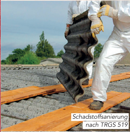
Schadstoffsanierung nach TRGS 519