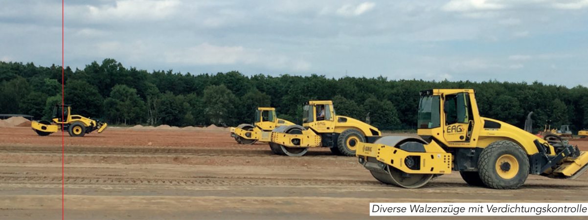
Diverse Walzenzüge mit Verdichtungskontrolle