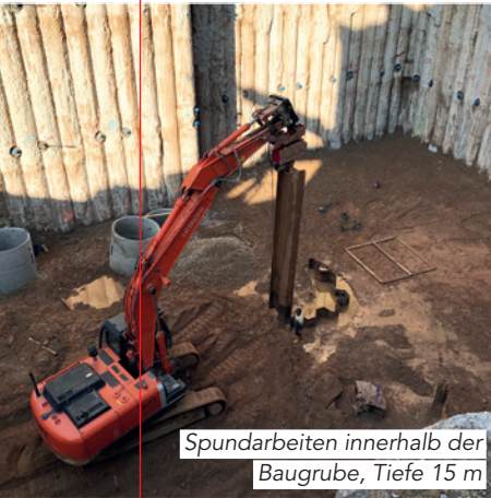
Spundarbeiten innerhalb der Baugrube, Tiefe 15 m