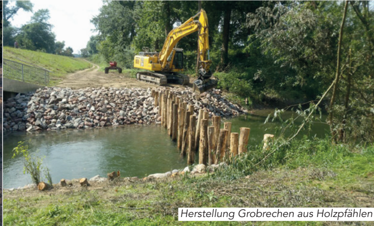
Herstellung Grobrechen aus Holzpfählen