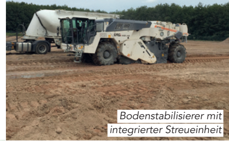
Bodenstabilisierer mit integrierter Streueinheit