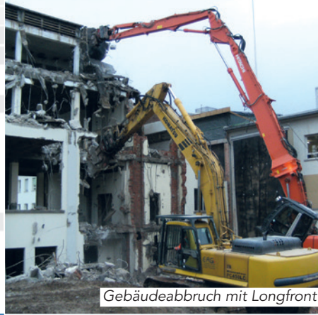
Gebäudeabbruch mit Longfront