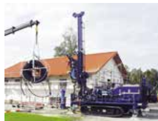
Erdsondenbohrung für eine Sole/Wasser-Wärmepumpe

Regenerative Energiequellen Luft, Erde und Wasser