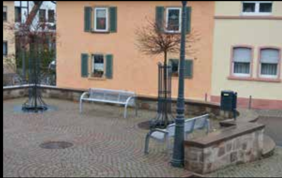
02 Neugestaltung Kirchplatz