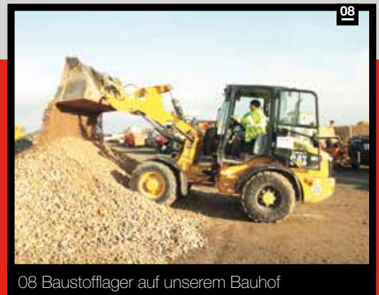
08 Baustofflager auf unserem Bauhof