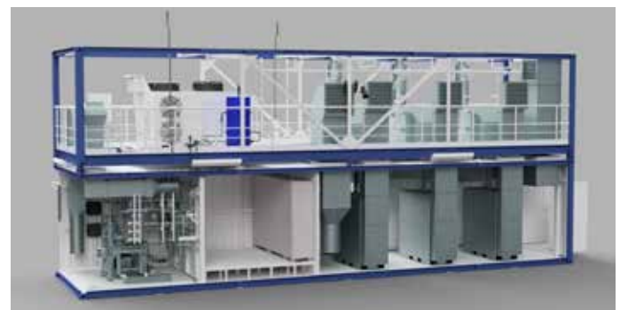
VPT All In Turn Key Container (3 Gasturbinen with Boostercompressor)