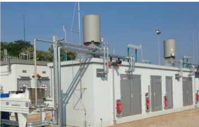
Bétoncontainer / Concrete container / Conteneur en béton