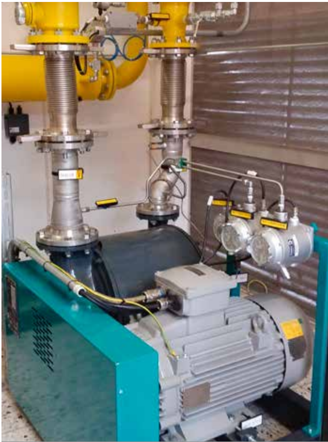
VPT Blower Solutions