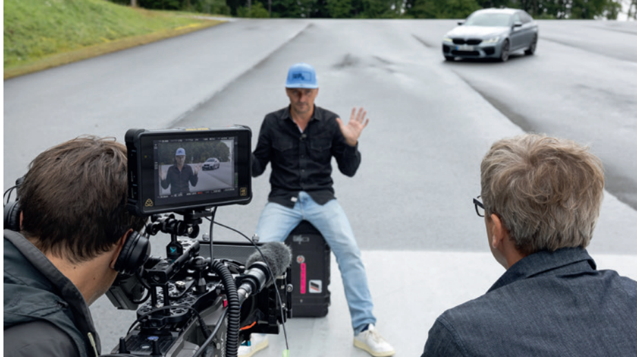
Photo- & Filmset