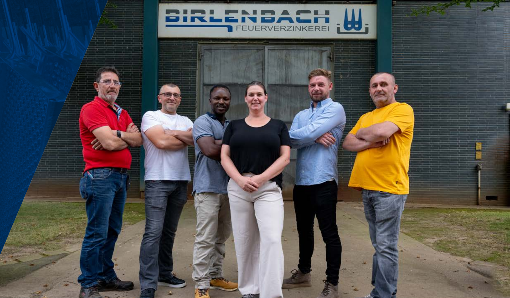
Die Führungsriege der Birlenbach Feuerverzinkerei GmbH & Co. KG