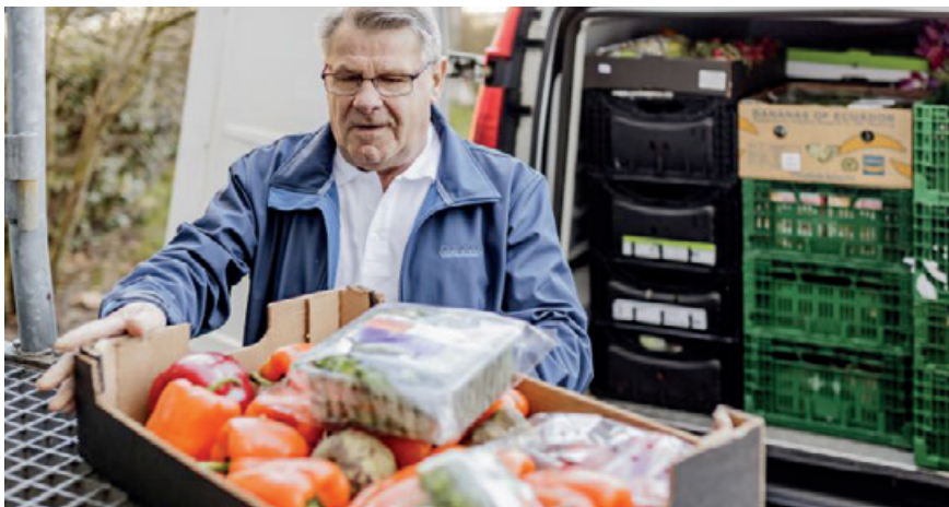
Unsere Tafeln helfen bedürftigen Menschen