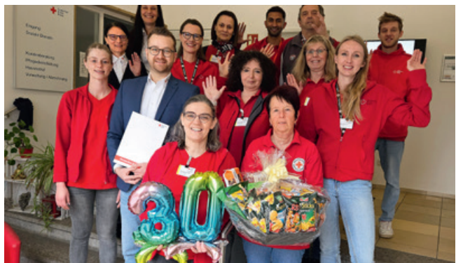
2025 feierten wir 30 Jahre Soziale Dienste