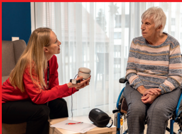
Beratung zum Hausnotrufsystem mit Sprachsteuerung