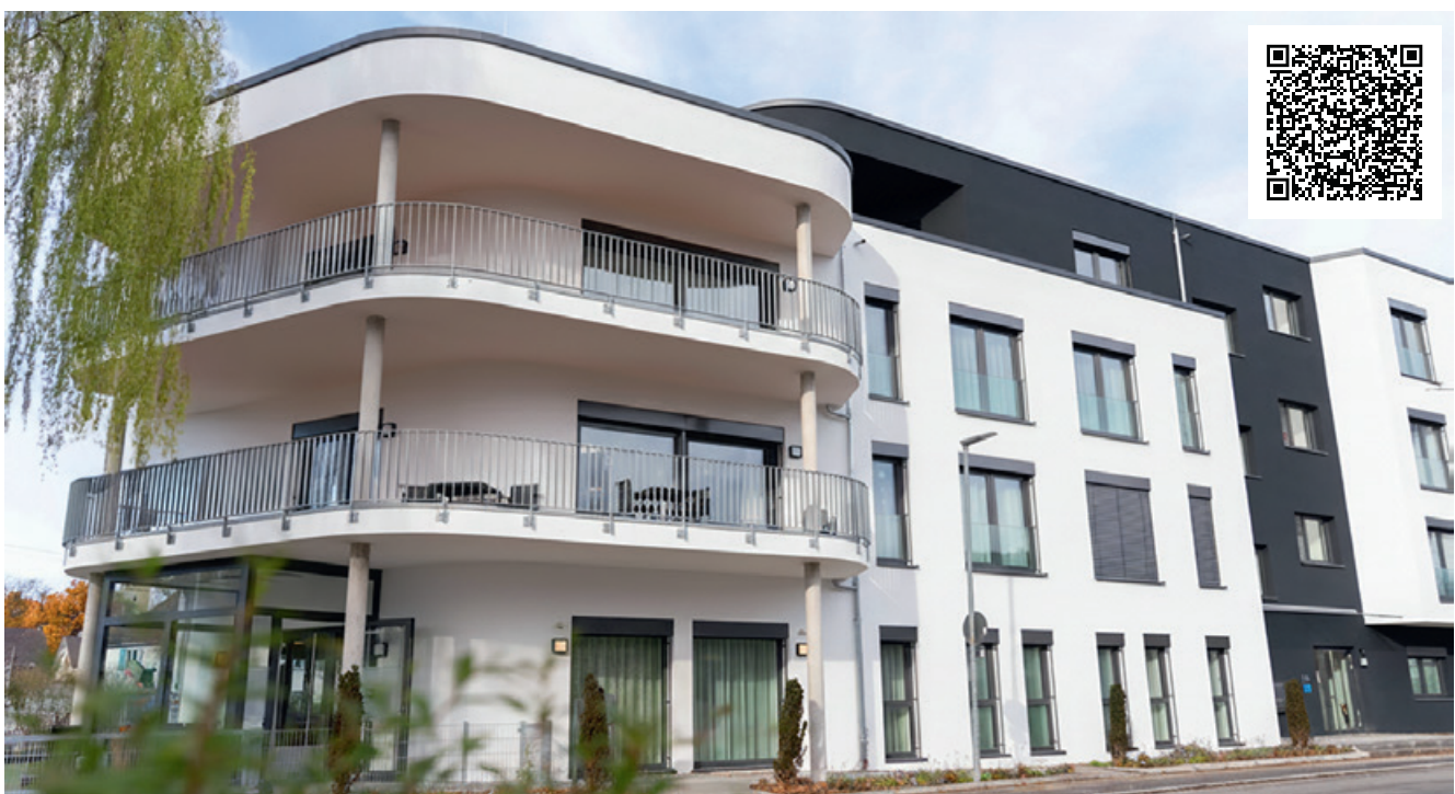
Mitten im Leben: Das Haus am Stachus in Meßkirch

Zusätzlich bieten wir betreutes Wohnen in barrierefreien Wohnungen an: selbstbestimmtes Leben mit Unterstützung nach Bedarf. Das DRK begleitet mit hauswirtschaftlichen und pflegerischen Leistungen, sodass Alltag und Sicherheit harmonisch zusammenfinden.