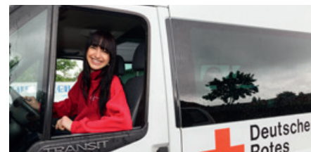
Fahrdienst in der Schülerbeförderung