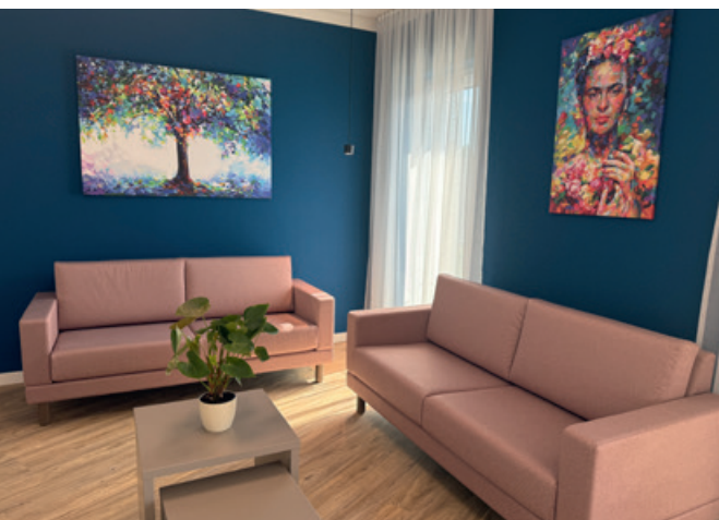
Wohnbereich der Wohngemeinschaft „Junge Pflege“