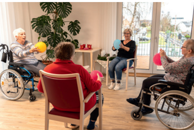
Gemeinsam aktiv sein