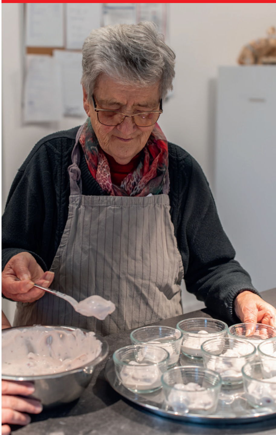
Bei der gemeinsamen Essenszubereitung