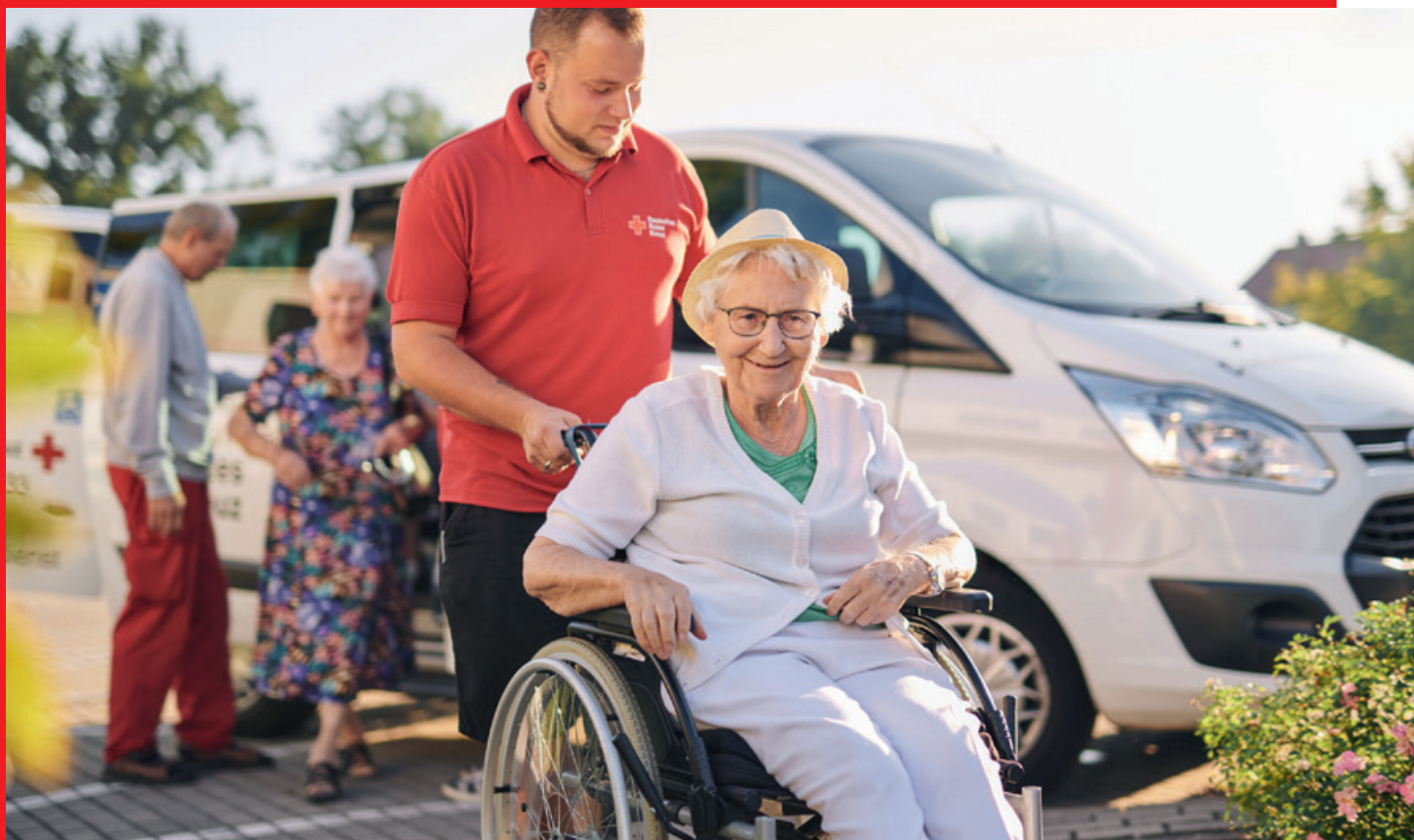
Fahrdienst für Senioren, Kinder und Jugendliche mit Unterstützungsbedarf