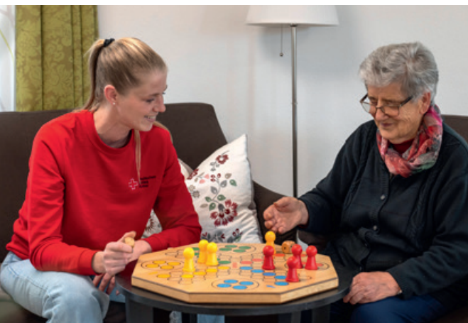
Gemeinsam Zeit verbringen