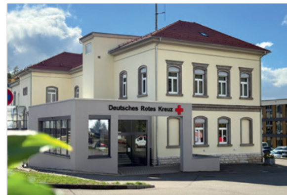
DRK-Kreisgeschäftsstelle in Sigmaringen