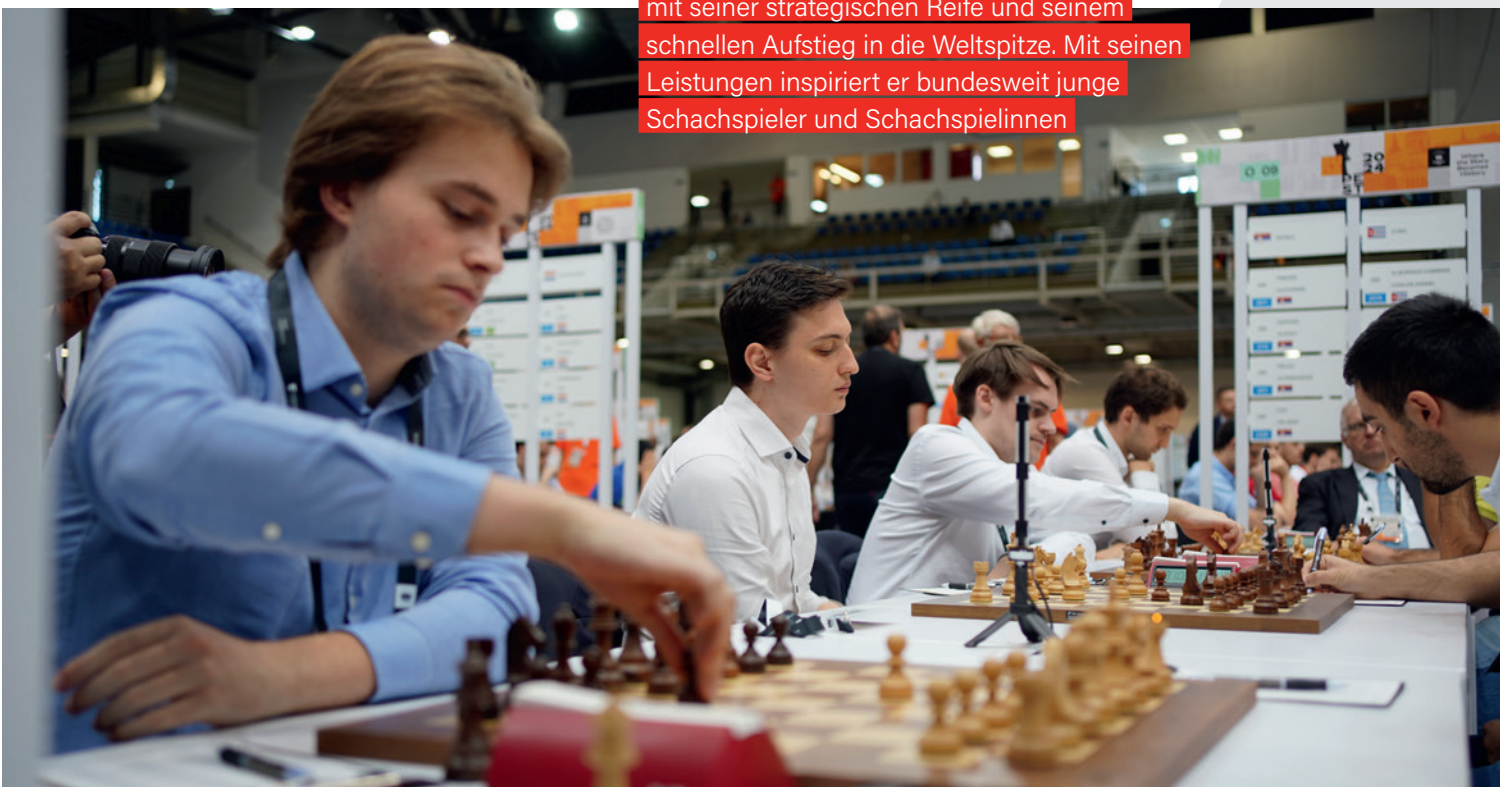
Vincent Keymer, Deutschlands jüngster Großmeister, beeindruckt mit seiner strategischen Reife und seinem schnellen Aufstieg in die Weltspitze. Mit seinen Leistungen inspiriert er bundesweit junge Schachspieler und Schachspielerinnen

Unsere Nationalmannschaften begeistern regelmäßig bei europäischen und weltweiten Turnieren. Von starken Auftritten bei der Schacholympiade bis zu Podiumsplätzen bei Europameisterschaften – die Teams repräsentieren Deutschland mit Stolz, Leistung und außergewöhnlichem Talent.