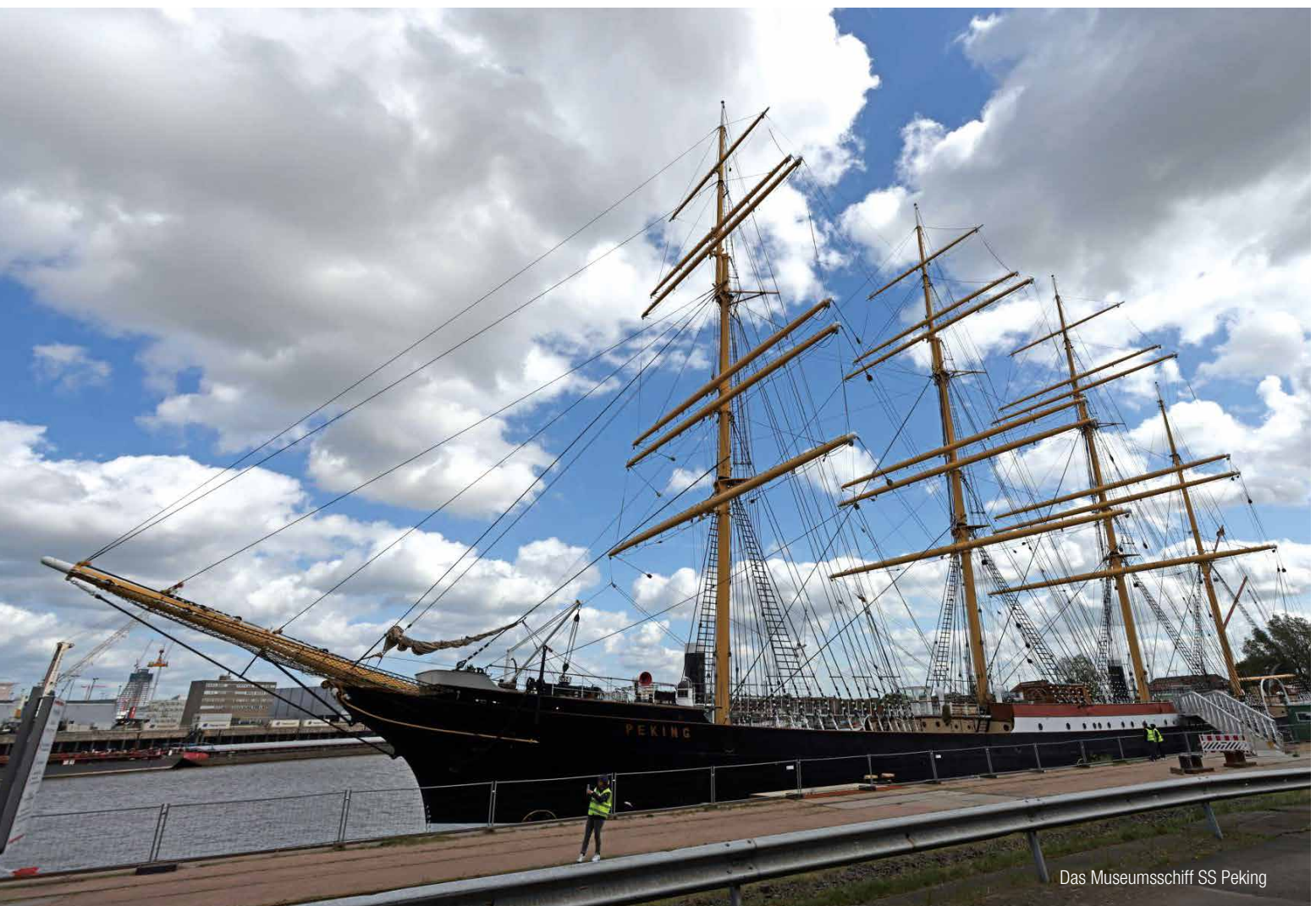
Das Museumsschiff SS Peking