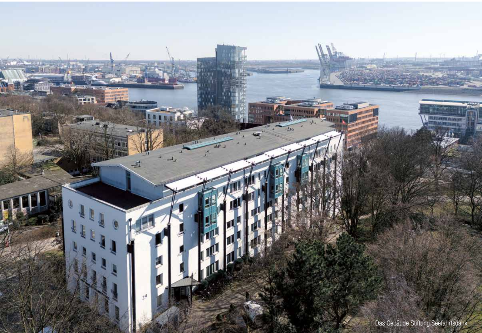
Das Gebäude Stiftung Seefahrtsdank