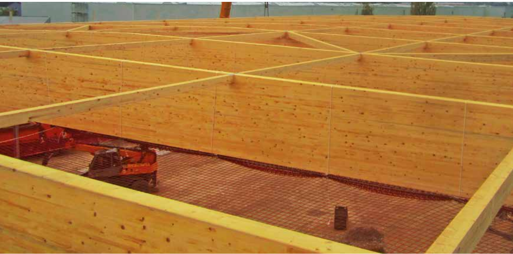
▲ Einkaufsmarkt, Zirndorf