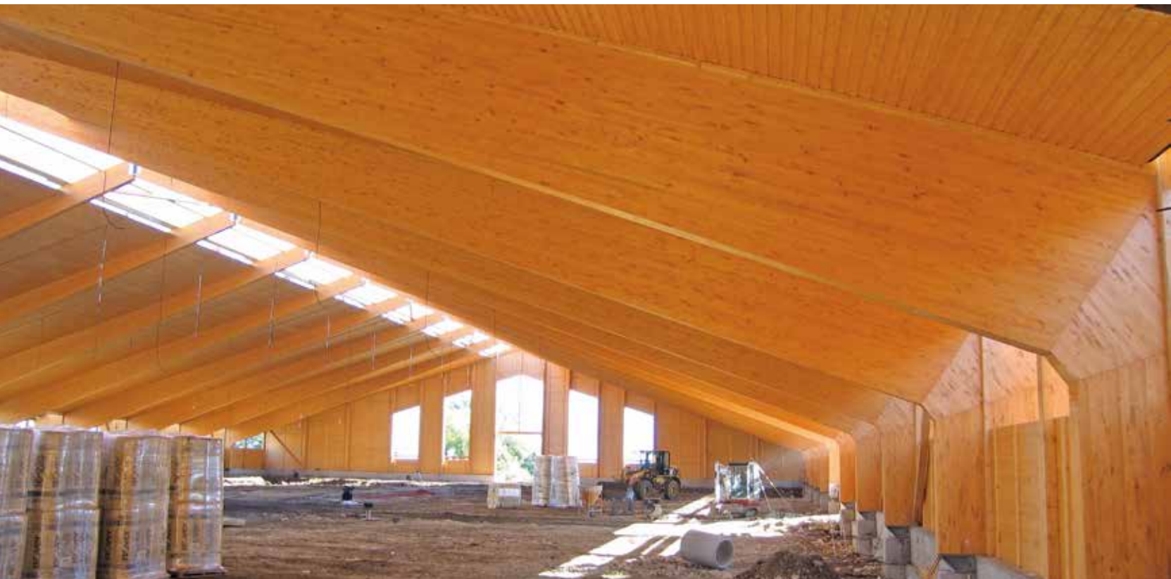
▲ Reithalle Michael Schumacher, Schweiz