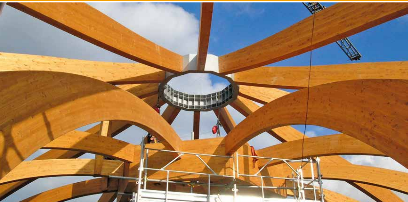
Kuppeldach, Italien ▼