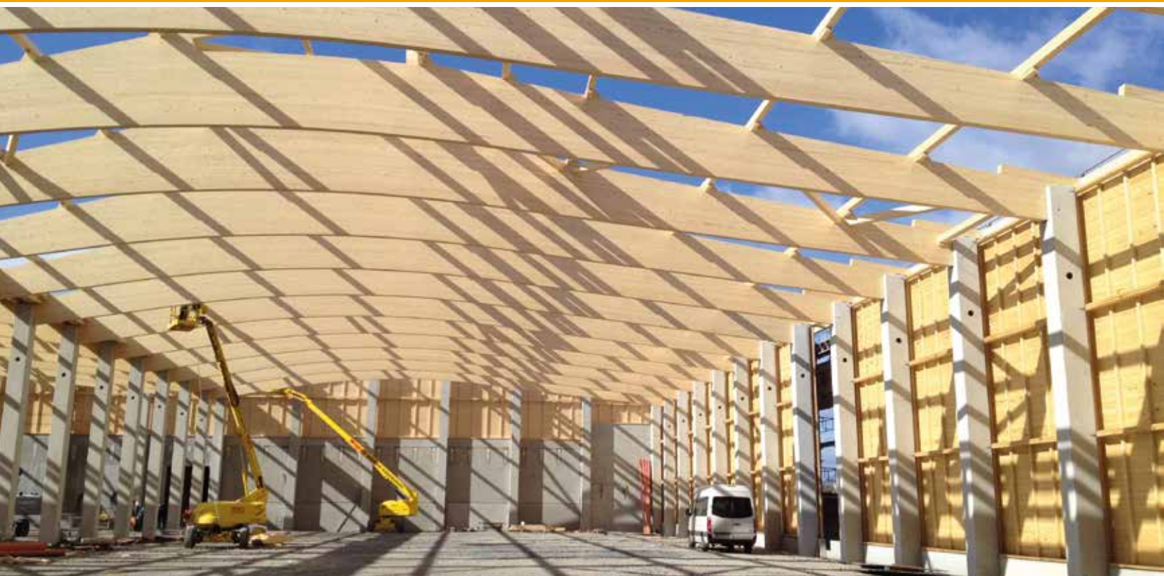
Industriehalle, Bad Rodach ▼