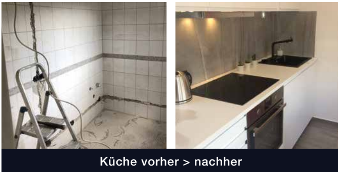
Küche vorher > nachher

Mit der GVS GmbH gewinnen Sie einen verlässlichen Partner, der Mieterbelange strukturiert, schnell und transparent steuert. Wir sind für Ihre Mieter rund um die Uhr erreichbar, bieten Online-Support und übernehmen das komplette Vertragsmanagement – von der Interessentenprüfung inkl. Bonitätscheck über den Vertragsabschluss bis zum Beschwerdemanagement. Mieteingänge werden laufend überwacht; Mahnwesen und die Prüfung von Mieterhöhungspotenzialen erfolgen regelkonform und nachweisbar.