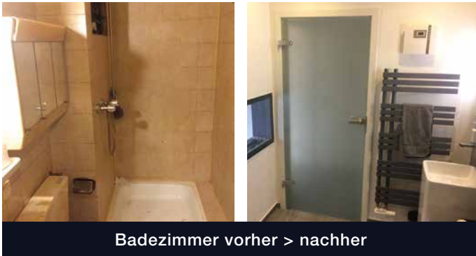
Badezimmer vorher > nachher