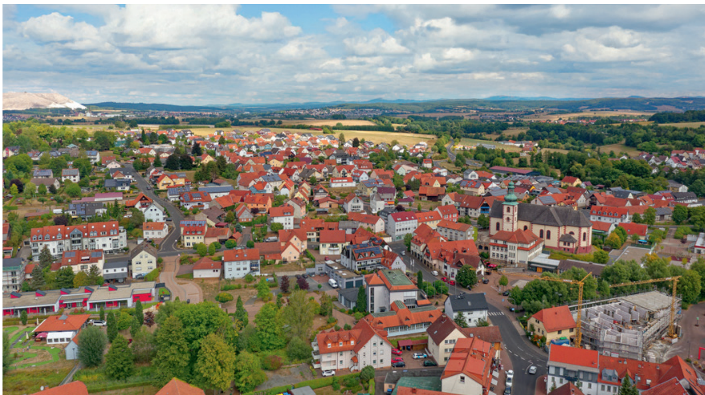
Panorama Dorfzentrum Flieden