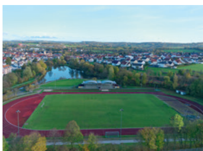
Das Stadion in Flieden

Wichtiger Bestandteil des Fliedener Gemeindelebens sind seine unzähligen Vereine für verschiedenste Interessen. Von Vereinen mit kulturellem oder traditionellem Hintergrund über sportlich orientierte Vereine bis hin zu Vereinen, die sich caritativen Aufgaben widmen, ist für jeden etwas dabei. Wer Geselligkeit mag und seine Freizeit mit Gleichgesinnten verbringen möchte, der ist in unseren Vereinen bestens aufgehoben. Weitere Informationen zum Vereinsangebot finden Sie auf unserer Website.