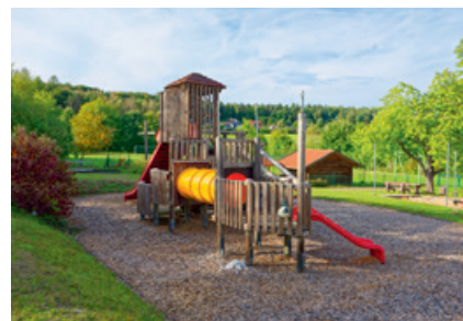
Spielplatz auf der Struth