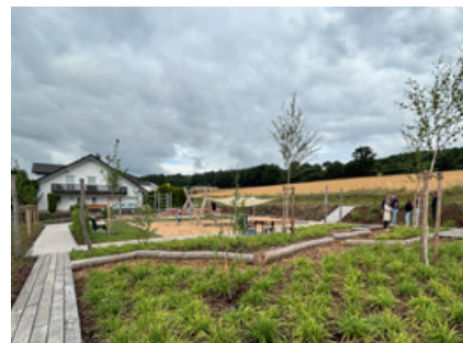
Neu gestalteter Spielplatz in der Elsa-Brändström-Straße in Flieden

Bereits seit fast 50 Jahren wird auf dem Dorfplatz das Kirmeswochenende gefeiert.