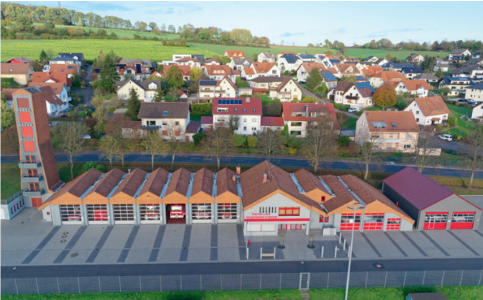
Freiwillige Feuerwehr Flieden