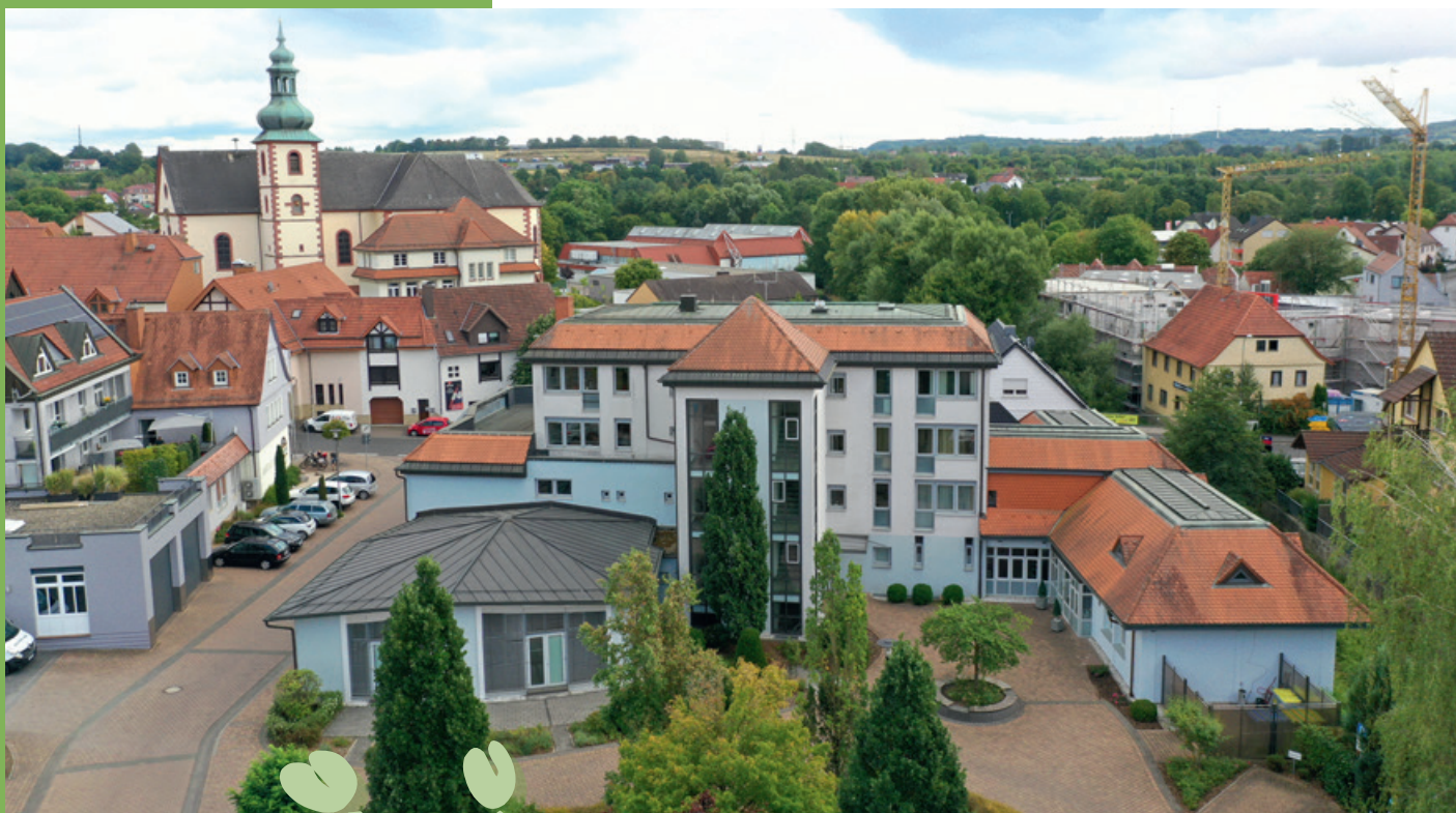
Rathaus und katholische Kirche in Flieden