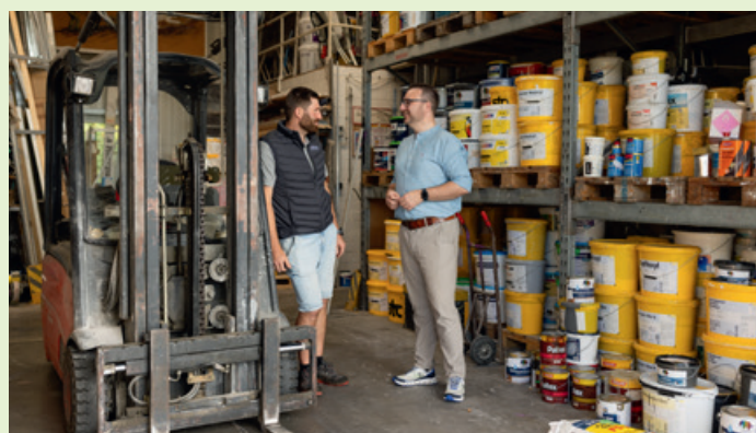
Modernes Handwerk mit Tradition