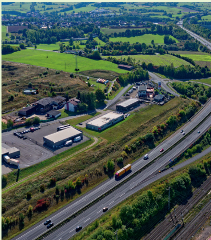
Autobahnanschluss, eigener Bahnhof und zwei Industriegebiete