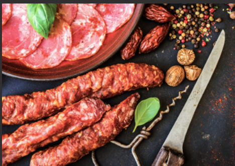
Wurstwaren und Schinken