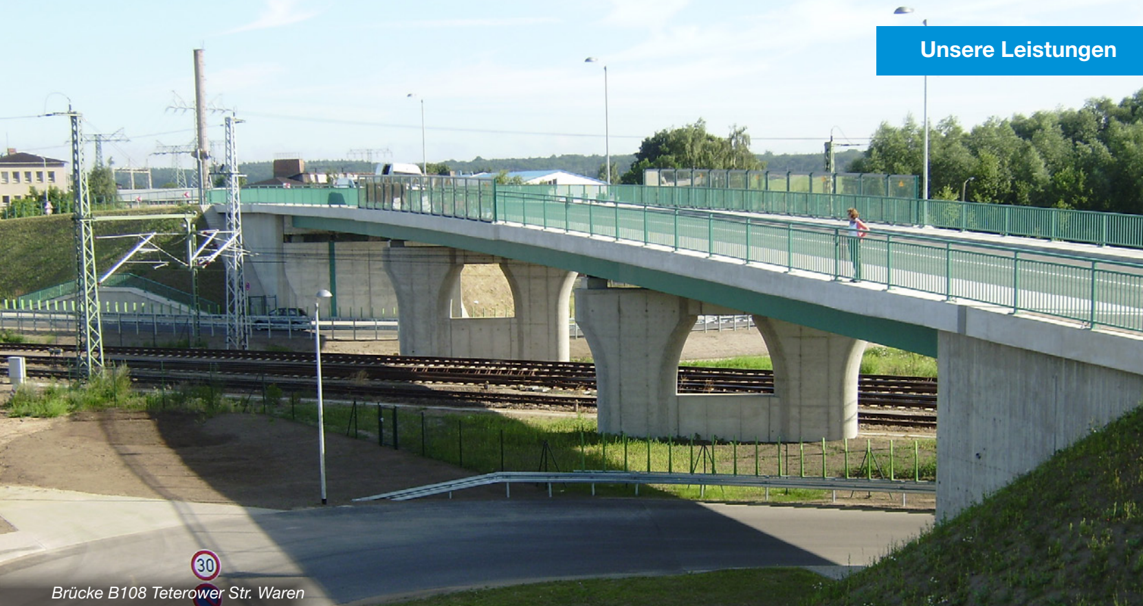
Brücke B108 Teterower Str. Waren