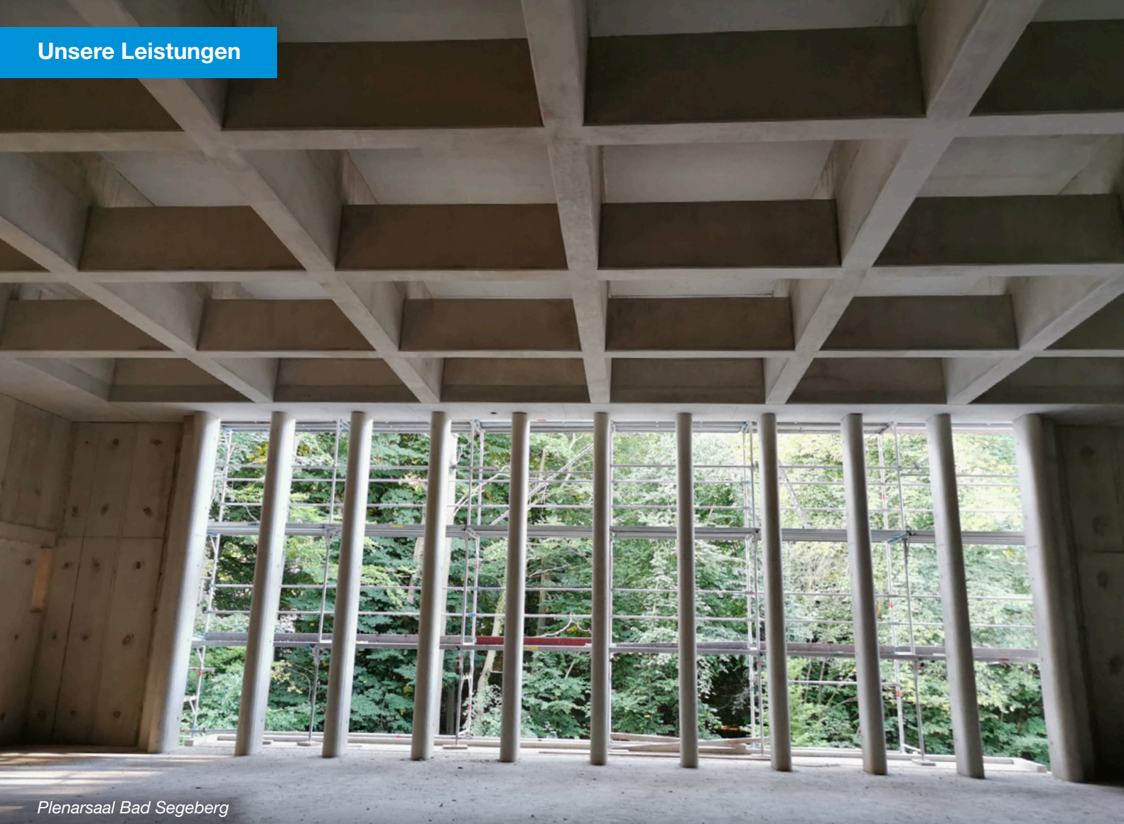
Plenarsaal Bad Segeberg