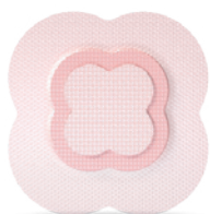
ALLEVYN ® LIFE Silikon-Schaumverbände

der Körperoberfläche, die bereits lange Zeit besteht oder lange bestehen zu bleiben droht. Sie ist das Symptom einer systemischen Erkrankung (z. B. Diabetes mit PNP, Arteriosklerose mit pAVK, venöse Insuffizienz) oder einer ständigen, physiologischen Belastung (z. B. Dekubitus, Diabetischer Fuß). Ohne Erkennen und Behandlung der Ursache kann eine chronische Wunde auch unter sachgerechter, moderner, lokaler Therapie nicht abheilen. Wir erstellen Wundvisiten, Fotodokumentationen, Therapiepläne und stellen Verbrauchsmaterial bereit sowie die Rezeptabrechnung.