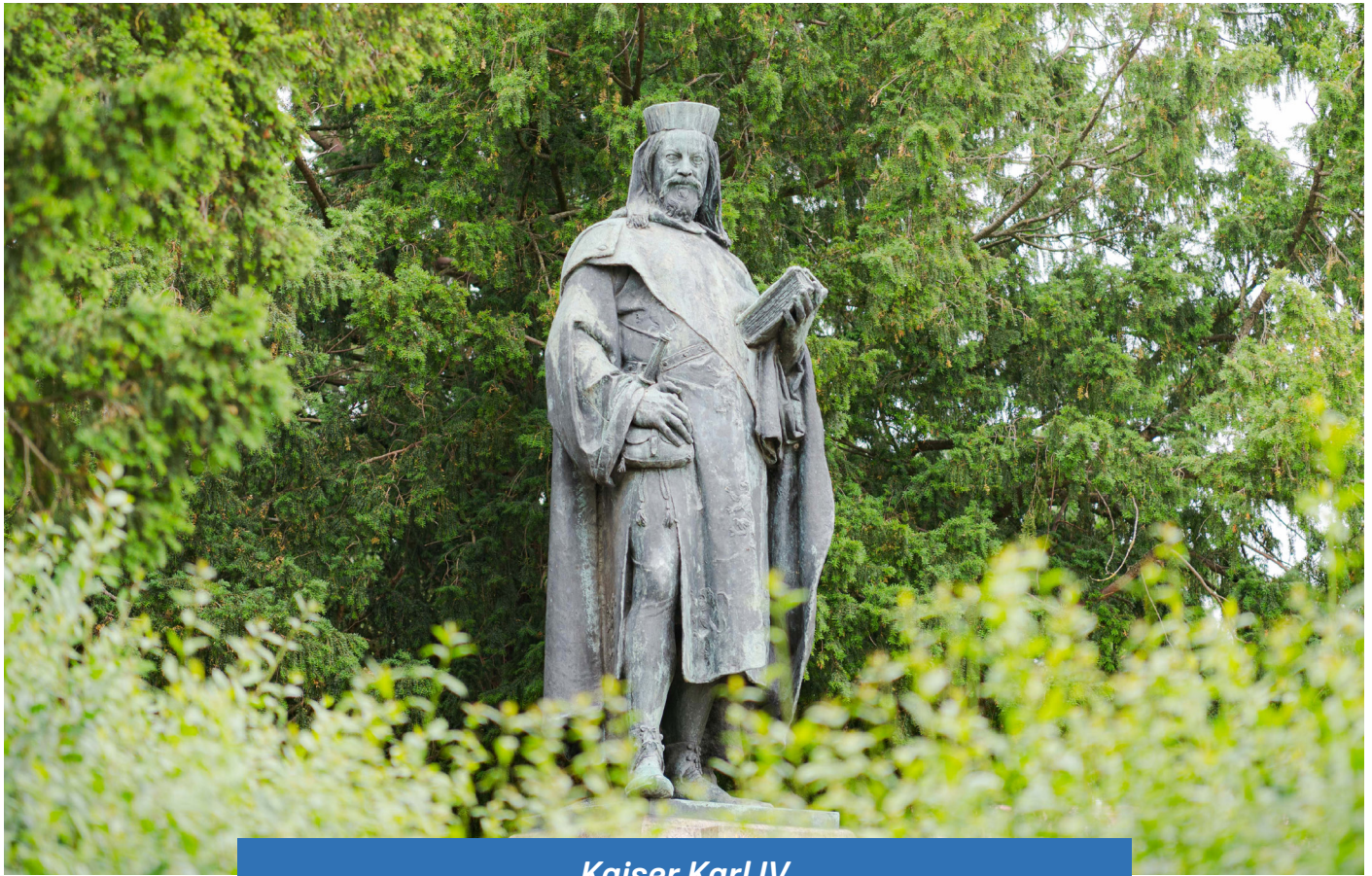
Kaiser Karl IV