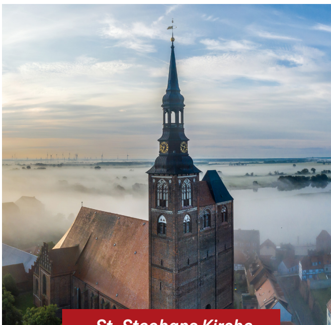
St. Stephans Kirche