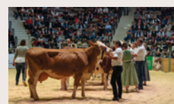
► 2023 Gefüllte Halle bei der 8. Deutschen Fleckviehschau