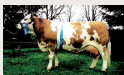
► 2002 Ausstellungskuh