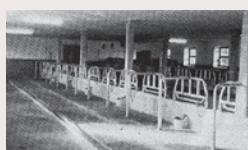
► 1987 Ankauf des Hofes in Öd