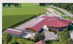
► 2014 Eröffnung der neuen Oberlandhalle