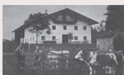
► 1976 Ankauf des Weidehofs Dörsdorf