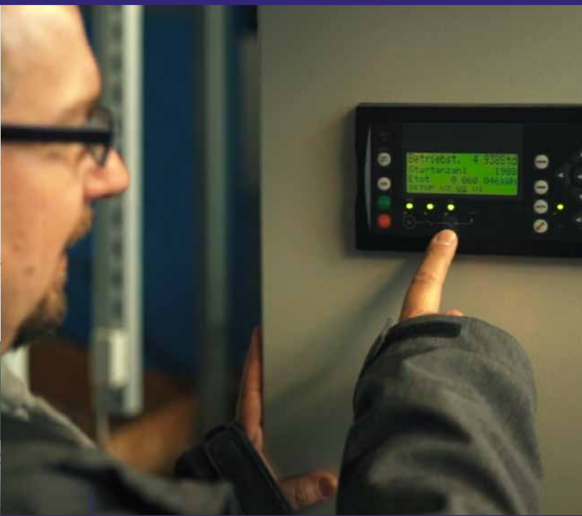
Elektroinstallationen vom Profi