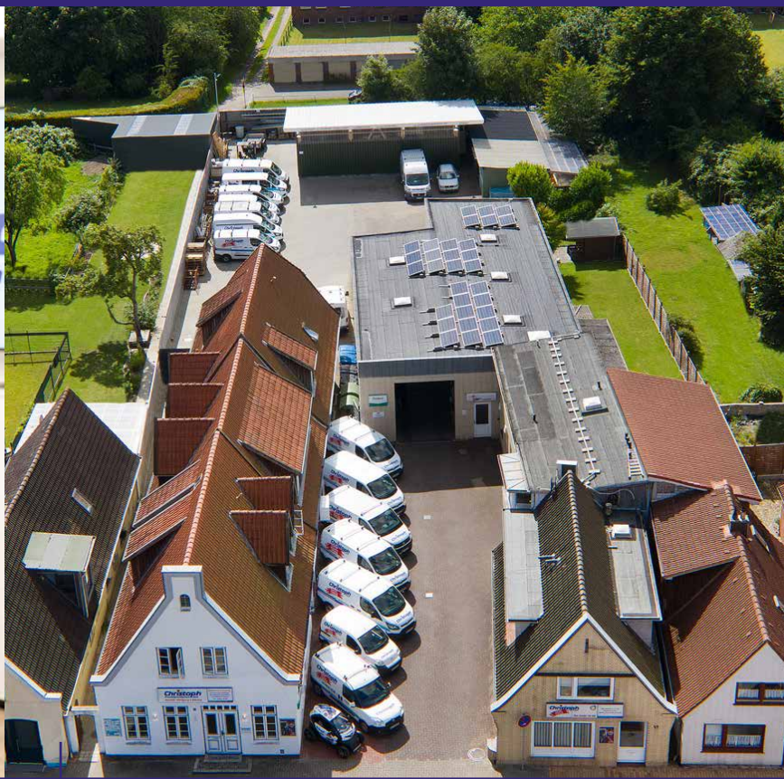
Christoph-Firmengruppe, Standort Heide