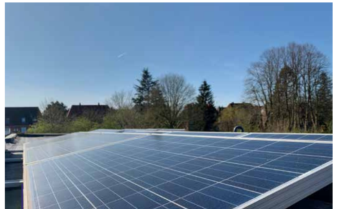
Nachhaltige Energie durch Fotovoltaik

Mit einer Fotovoltaikanlage haben Sie Ihr ganz persönliches Sonnenkraftwerk auf dem Dach. Damit senken Sie Ihre Betriebs- oder Nebenkosten und leisten einen wichtigen Beitrag zum Umweltschutz. Abgesehen davon machen Sie sich weitestgehend unabhängig von externen Energieanbietern. Andere Möglichkeiten, Sonnenenergie auf eigene Faust zu nutzen, sind Solarthermieanlagen oder Sonnenkollektoren, die ebenfalls 100 % des sommerlichen Warmwasserbedarfs decken können.