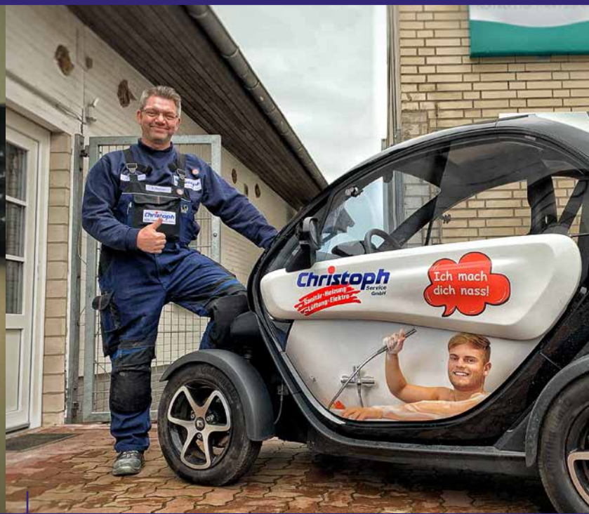
Wir setzen auf E-Mobilität