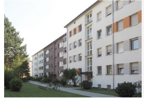
Baumbachstraße 21, München Josef-Seliger-Straße, Dachau