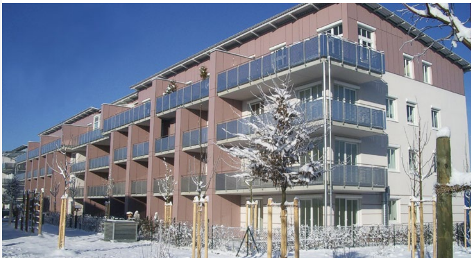
Wohnanlage Ludwig-Thoma-Straße, Unterschleißheim