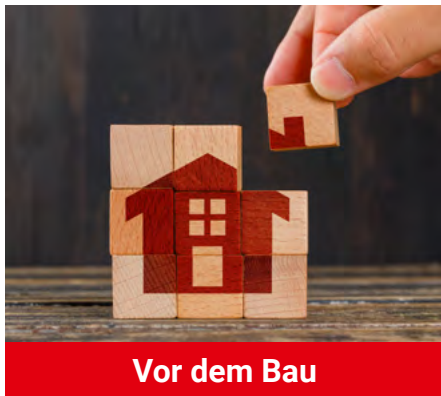
Vor dem Bau

Damit das Traumhaus nicht zum Albtraum wird, sorgen wir als zuverlässiger und erfahrener Partner an Ihrer Seite für einen sicheren und reibungslosen Ablauf – vom ersten Beratungsgespräch bis zur Schlüsselübergabe. Unser Bauqualitäts- und Baufinanz-Schuttbrief schützt Sie vor allen Eventualitäten beim Hausbau. Mit unseren umfangreichen Serviceleistungen sorgen wir dafür, dass Sie entspannt in Ihr neues Massivhaus einziehen können.