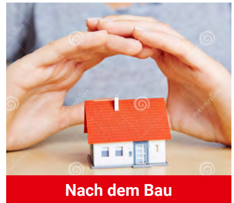
Nach dem Bau