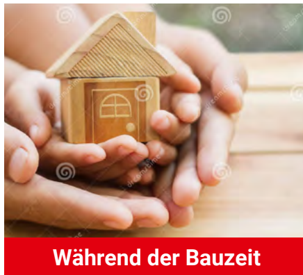
Während der Bauzeit